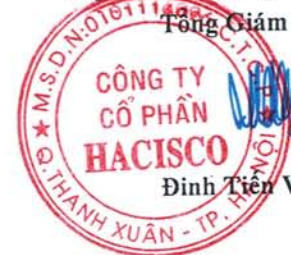
Đinh Tiên Vịnh